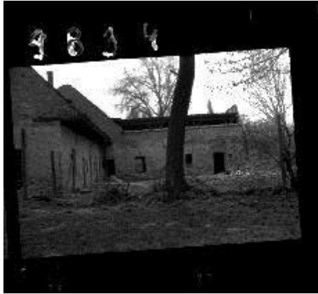
Tízes malom