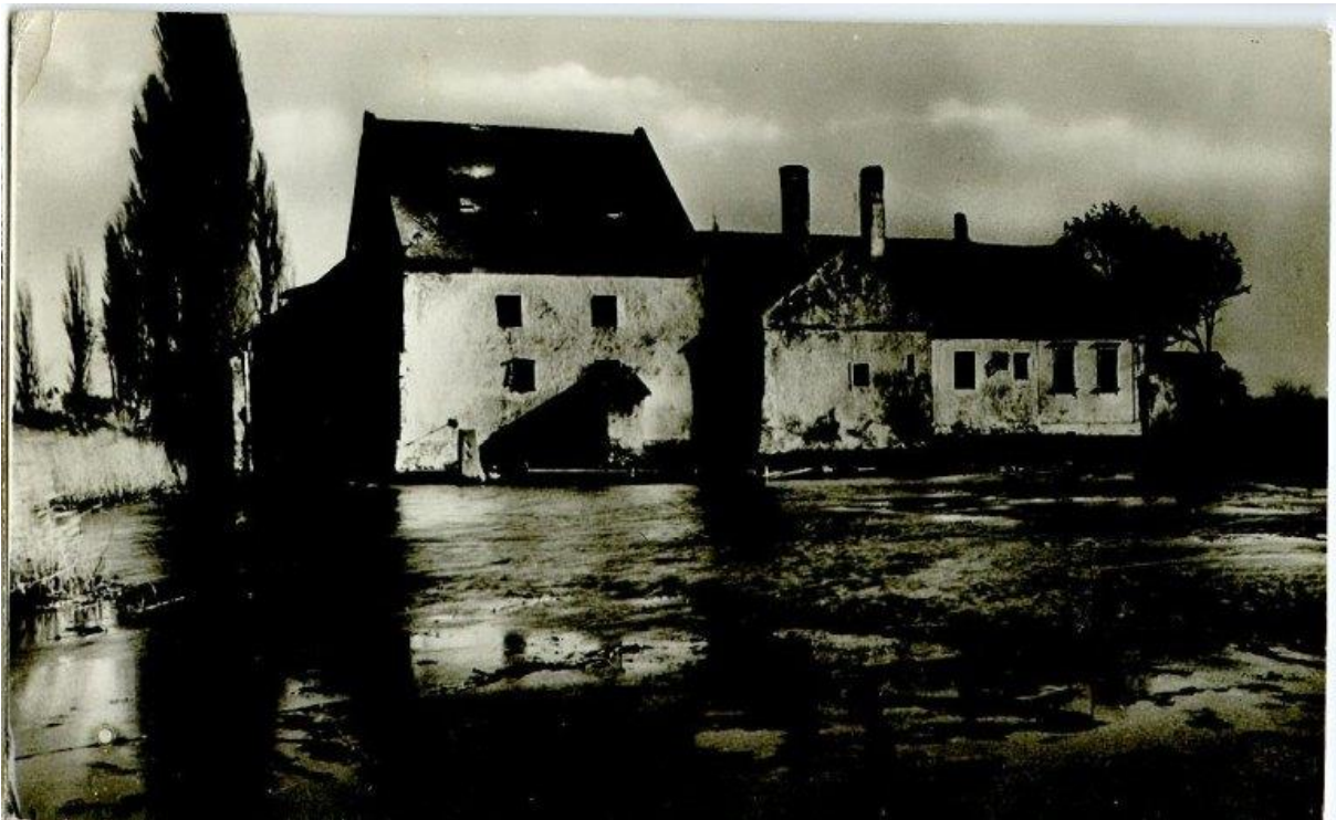
Fehér malom