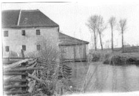
Zavari malom