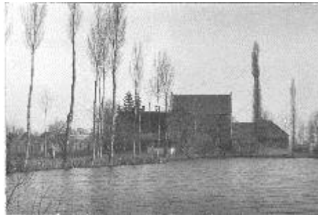
Sávolyi malom