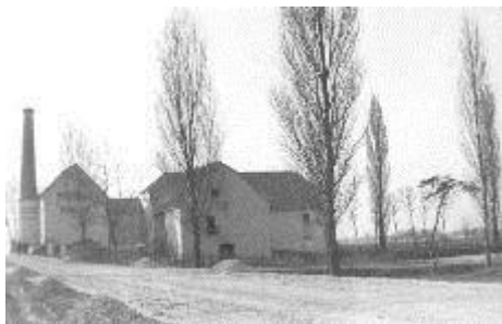
Papiros malom