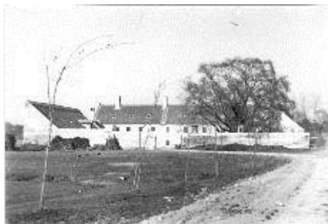
Hatkerekű malom