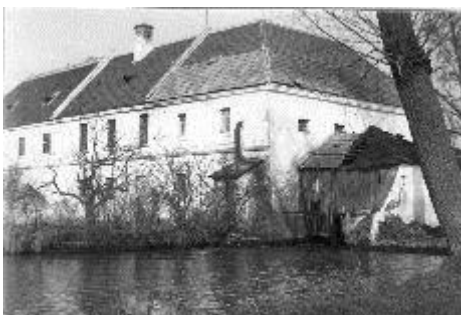
Hódoska malom