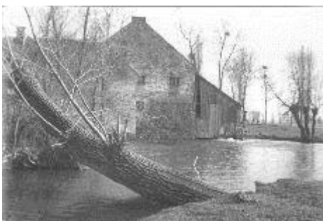
Kishantai malom