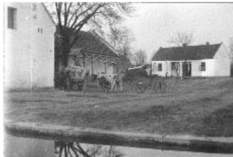
Nagyhantai malom