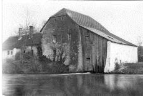
Csingeri malom