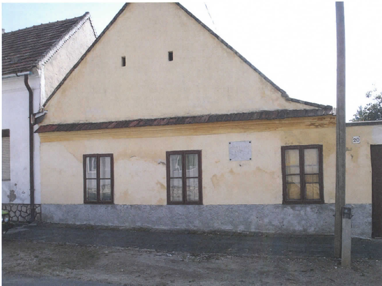
A költő egykori lakóhelyének homlokzata. Pápa, Világos utca 20. Sajnos, az épületet már csak fotók őrzik, pár esztendeje elbontották...