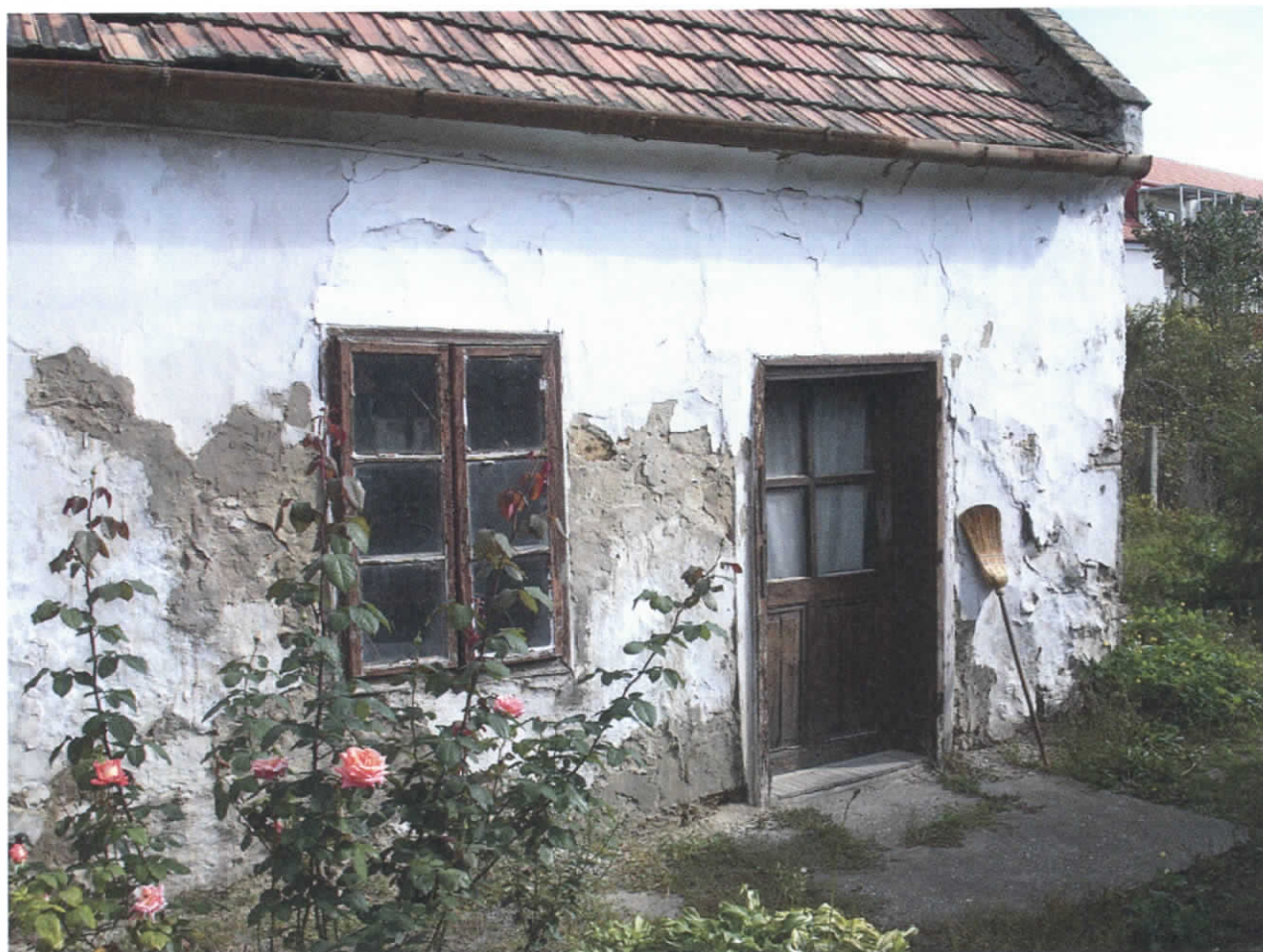
Nagy László egykori lakóhelyének udvari része. Pápa, Világos utca 20. Itt lakott a költő gyermekkorában nagyanyjával, testvéreivel, unokatestvéreivel 1938 augusztusától az 1945-ben letett érettségig. Ez a fotó is immár emlékdokumentum, az épületet pár esztendeje bontották el... (Fotó: Kerecsényi Zoltán, 2006. október)