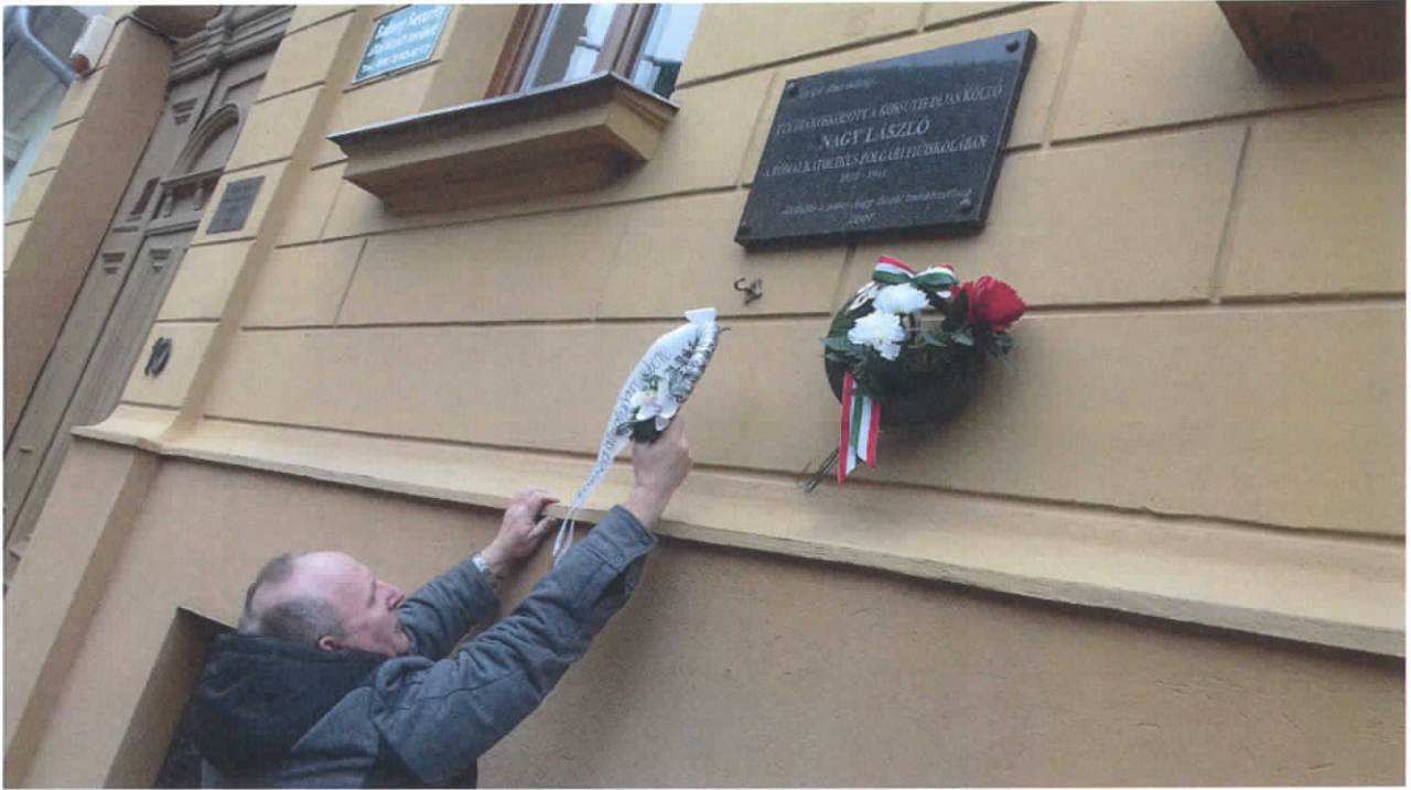
Az „Elsősorban pápai” Városbarát Egylet koszorúz az egykori pápai Római Katolikus Polgári Fűúiskola – ma Szent Anna Óvoda – épületénél (Pápa, Zimmermann János utca 10. sz.) 2018. január 27-én, Nagy László elhunytának 40. évfordulóján.