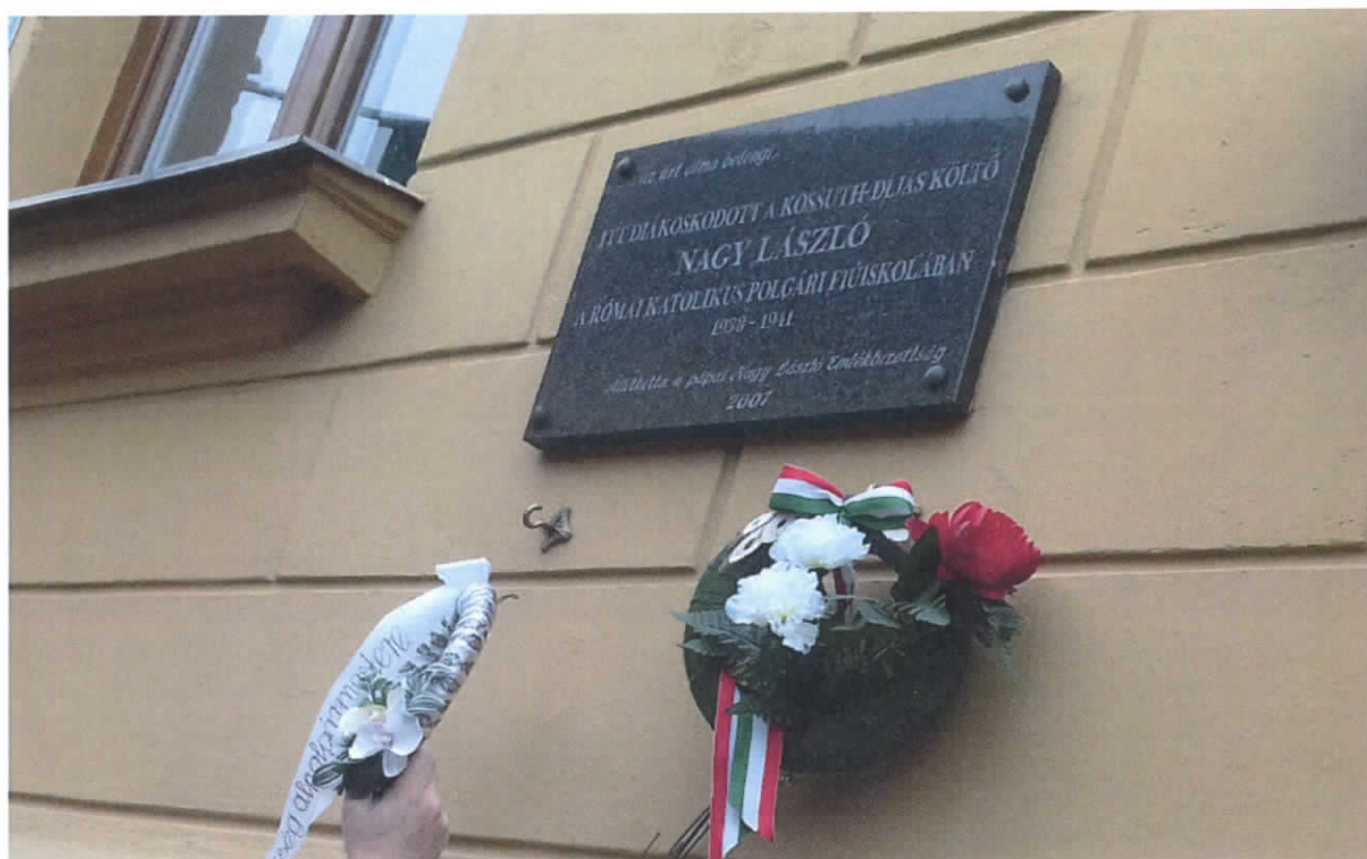
Az egykori Római Katolikus Polgári Fiuiskola – ma Szent Anna Óvoda – épületének főhomlokzatán 2007 óta áll a Nagy László- emléktábla a költő diákoskodásának emlékére. Pápa, Zimmermann János utca 10. sz.