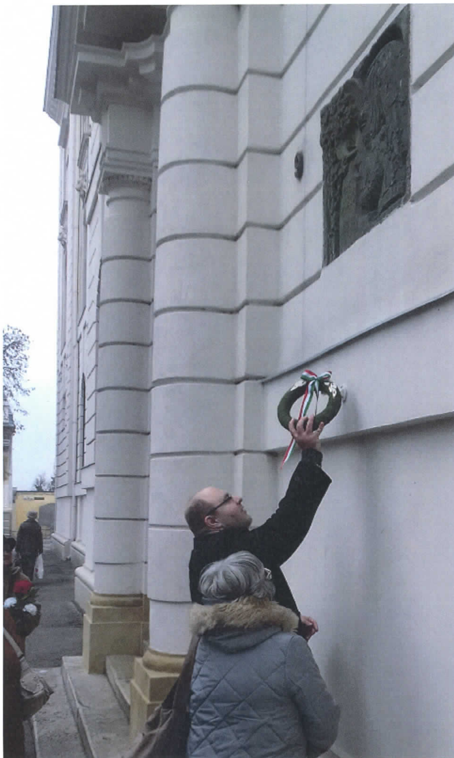
Az „Elsősorban pápai” Városbarát Egylet koszorút helyez el Somogyi József Kossuth-díjas szobrászművész Nagy László-domborművénél 2018. január 27-én, a költő halálának 40. évfordulóján. A relief 1981 óta a Pápai Református Kollégium Gimnáziuma Március 15. téri főhomlokzatán áll.