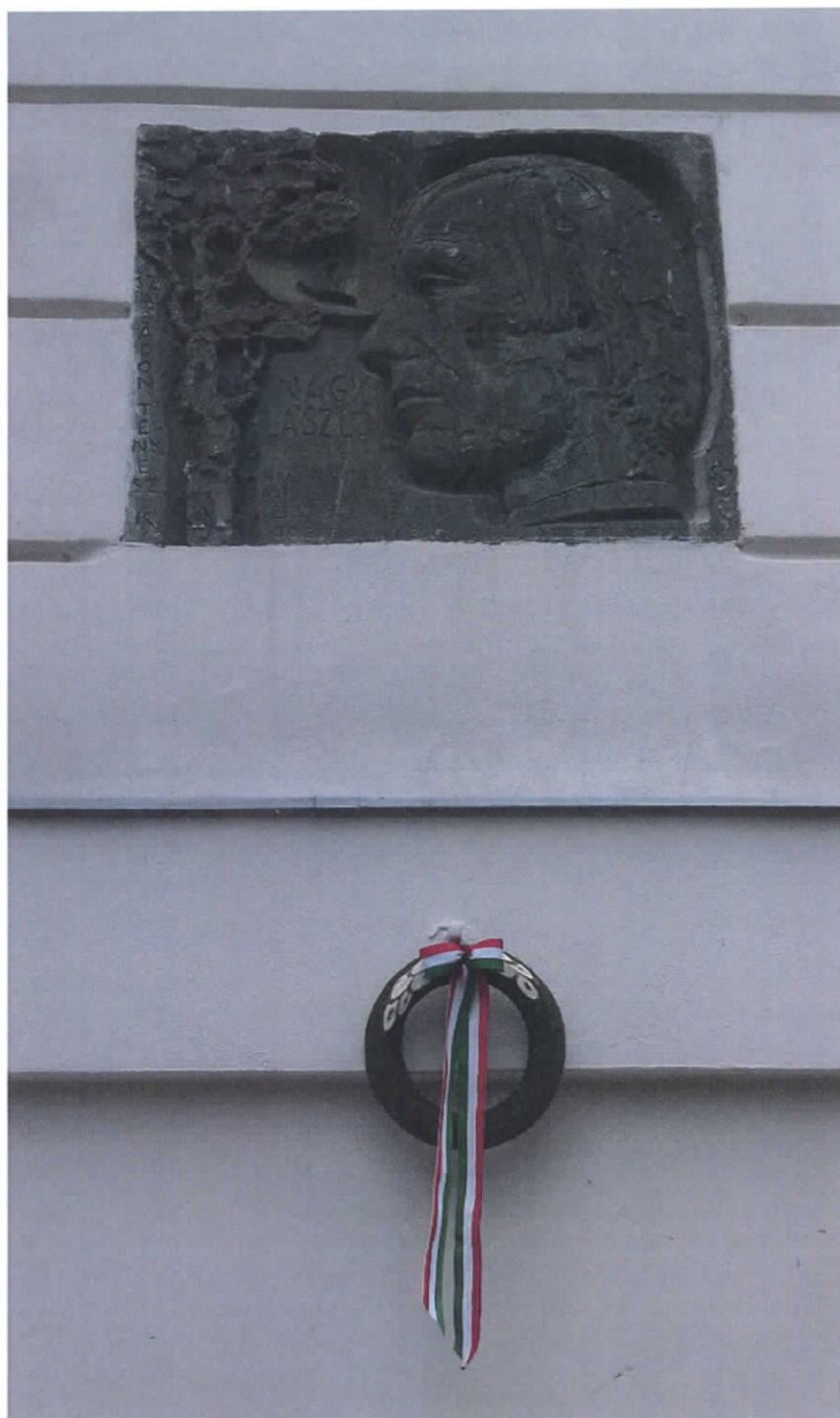
Az „Elsősorban pápai” Városbarát Egylet koszorúja Somogyi József Kossuth-díjas szobrászművész Nagy László-domborműve alatt 2018. január 27-én, a költő halálának 40. évfordulója alkalmából. A relief 1981 óta a Pápai Református Kollégium Gimnáziuma Március 15. téri főhomlokzatán áll.