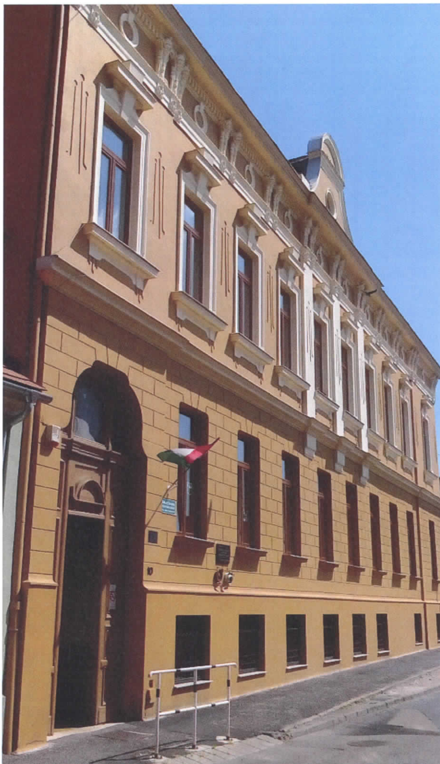
Az egykori Római Katolikus Polgári Fiúiskola – ma Szent Anna Óvoda – épületének főhomlokzata. Pápa, Zimmermann János utca 10. sz. Ide járt iskolába Nagy László 1938-1941 között.