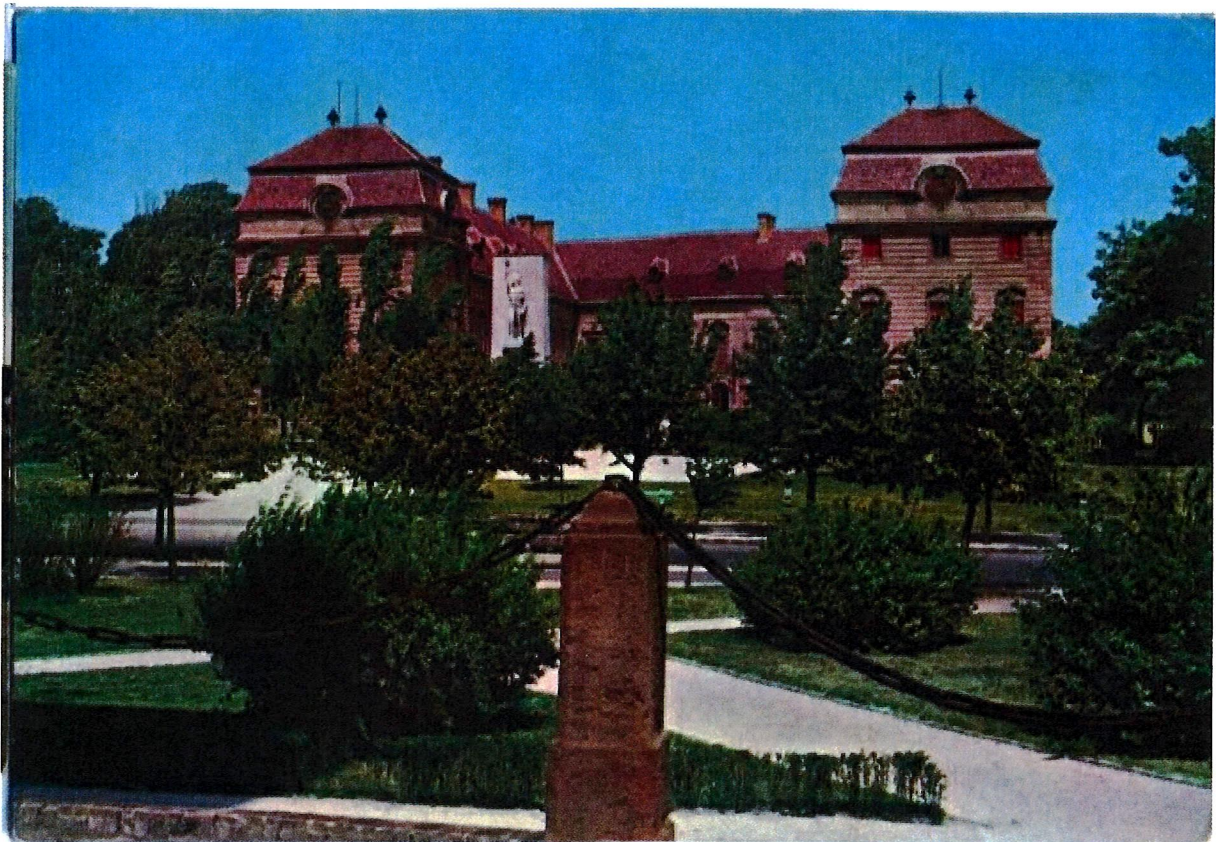
Esterházy-kastély épülete a 20. század második felében