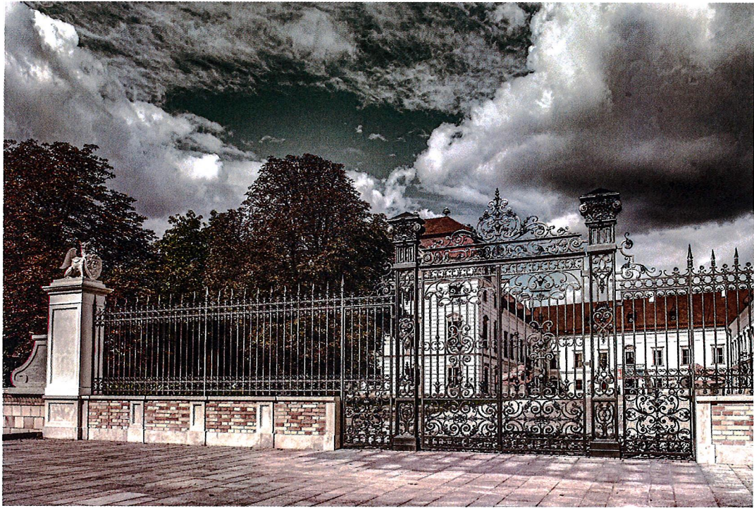
Esterházy-kastély kapuja napjainkban