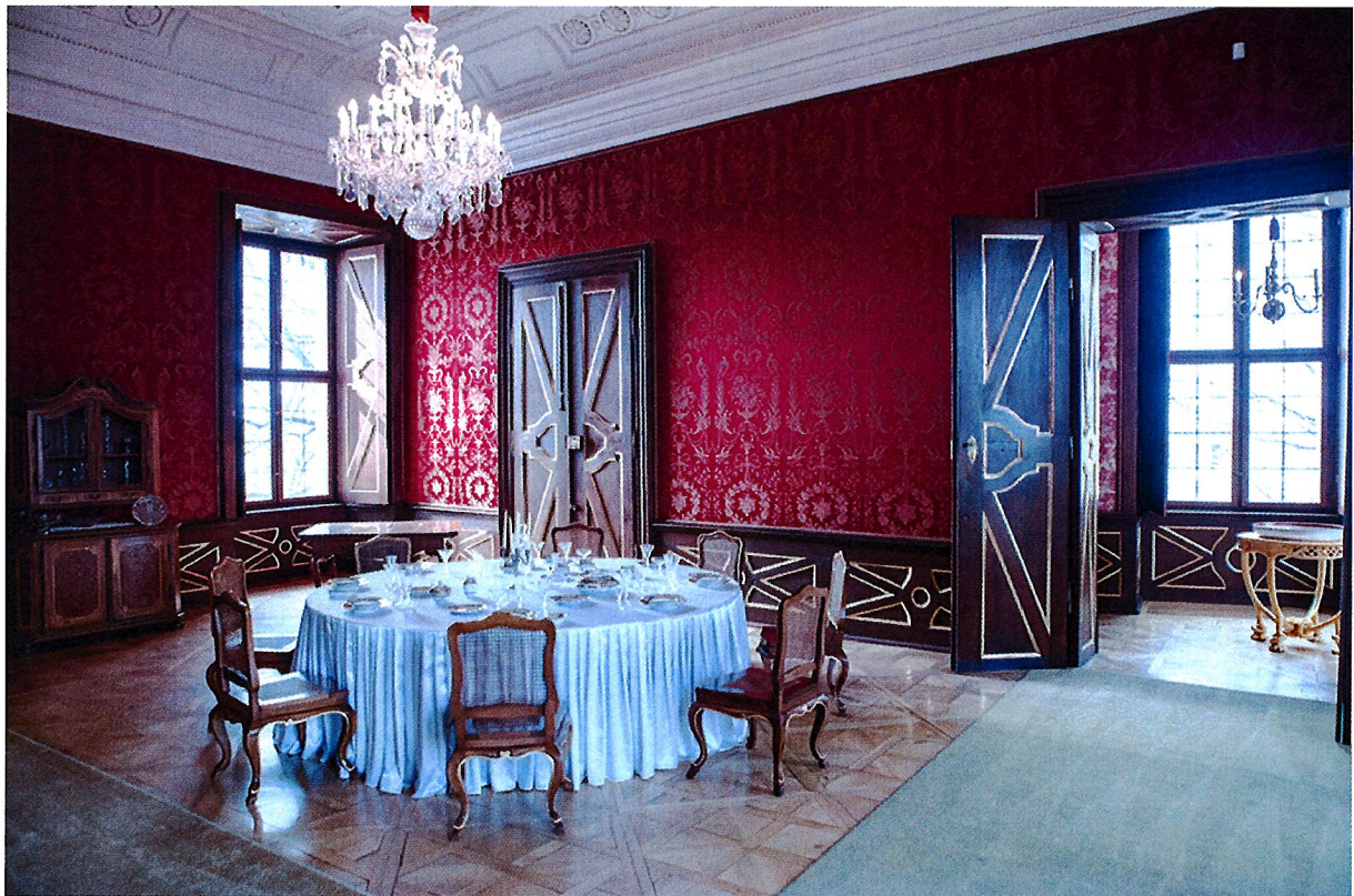
Vörös szalon napjainkban