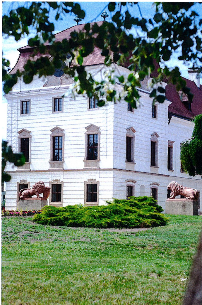
Esterházy-kastély kőoroszlánjai napjainkban