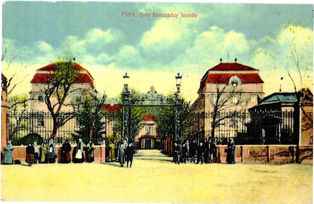
Esterházy-kastély épülete a 19. században