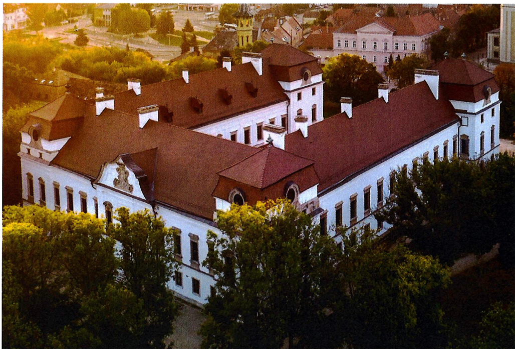
Esterházy-kastély napjainkban