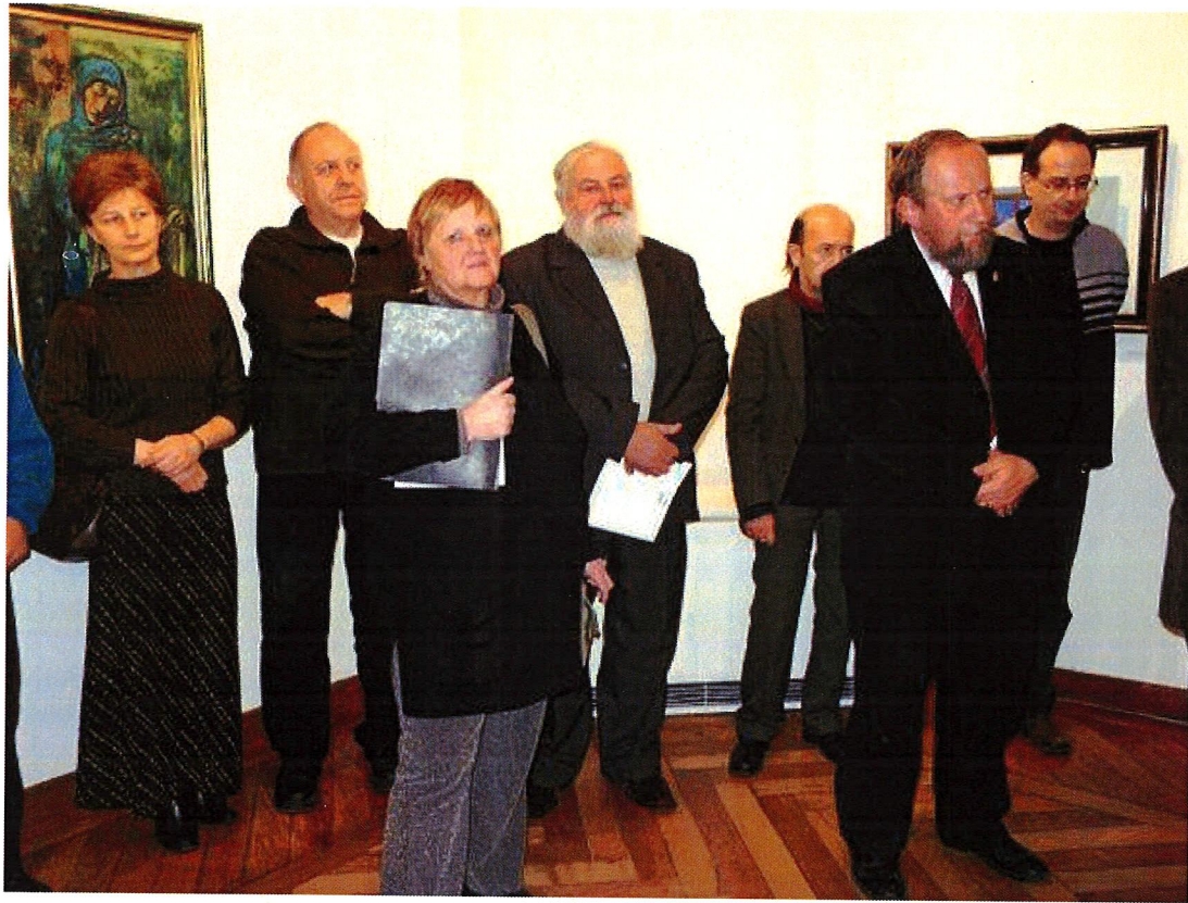
Megnyitó, 2024. június 13. – Pápai Tárlat